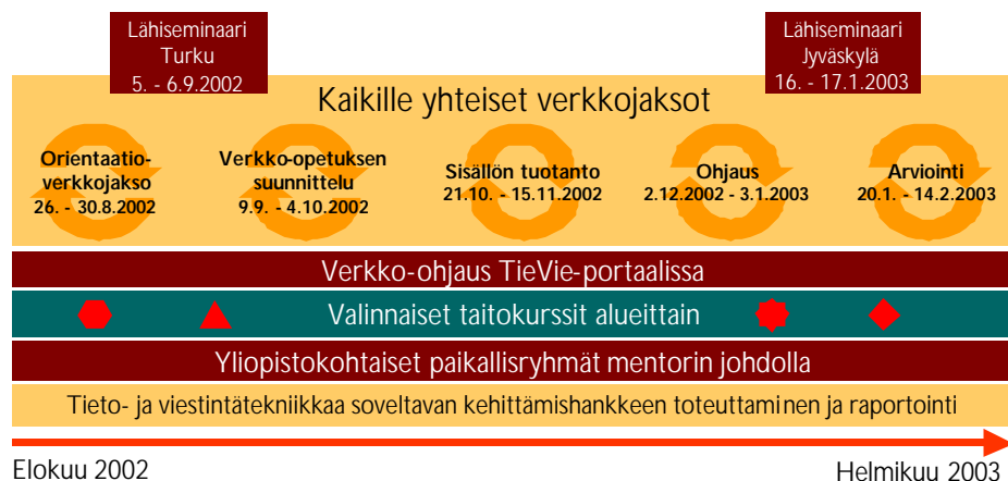
Kuvio 1. TieVie-koulutuksen (5 ov) rakenne vuonna 2002 – 2003.

TieVie-koulutus on rakentunut kahdesta valtakunnallisesta lähiseminaarista (4 pv), viidestä kaikille yhteisestä verkkojaksosta, paikallisten mentorryhmien tapaamisista, alueellisista taitokursseista sekä oman opetuksen kehittämishankkeen toteuttamisesta. TieVie-koulutukseen on osallistunut on osallistunut 160 osallistujaa. Koulutuksen osana on toiminut 25 yliopistokohtaista mentorryhmää, 36 mentorin johdolla. Yhteensä mentorit ovat järjestäneet n. 100 lähitapaamista, joissa osallistujat ovat saaneet omaan kehittämishankkeeseensa liittyvää henkilökohtaista ohjausta ja palautetta.