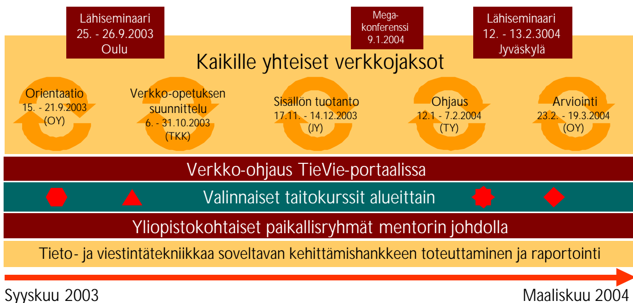
Kuvio 1. TieVie-koulutuksen (5 ov) toimintarakenne vuonna 2003.

Koulutus rakentuu valtakunnallisista lähiseminaareista ja verkkojaksoista, alueellisista taitokurseista ja yliopistokohtaisesta mentorryhmätyöskentelystä.