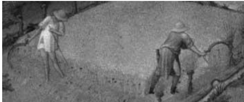
Historian valtakunnallinen verkko-opetus