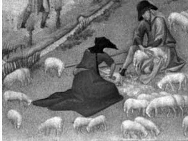
Historian valtakunnallinen verkko-opetus