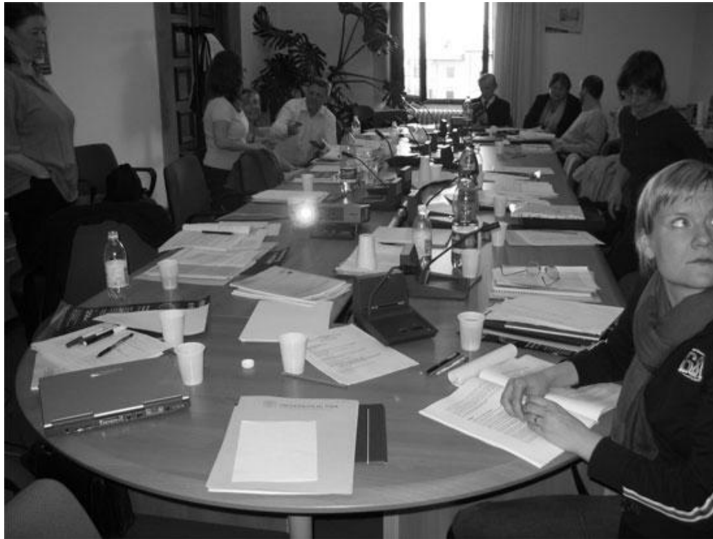
e-History Learning Environment and Evaluation