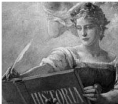
Historian valtakunnallinen verkko-opetus