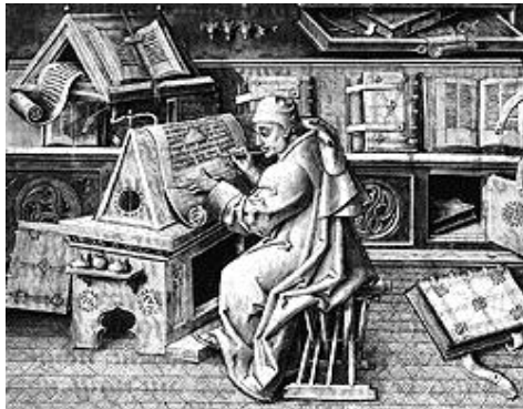
Historian valtakunnallinen verkko-opetus