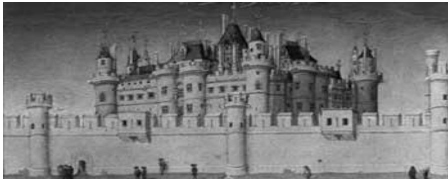
Historian valtakunnallinen verkko-opetus