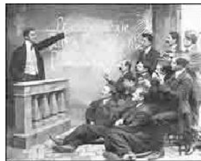
Historian valtakunnallinen verkko-opetus